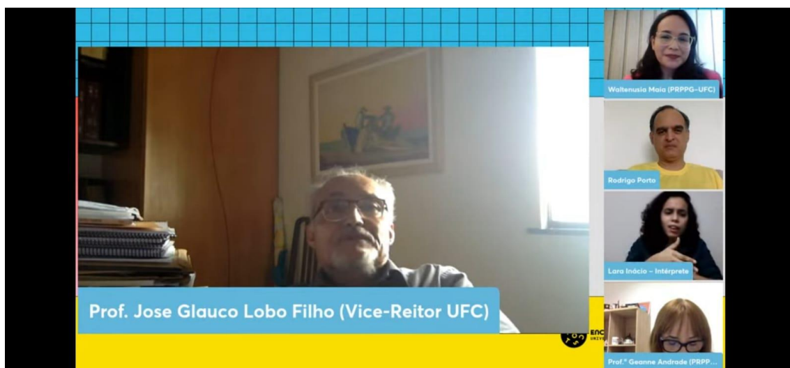
Figura: Interpretação Libras/Português em eventos (Encontros Universitários)