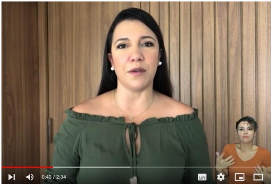
Figura: Programa Conexão