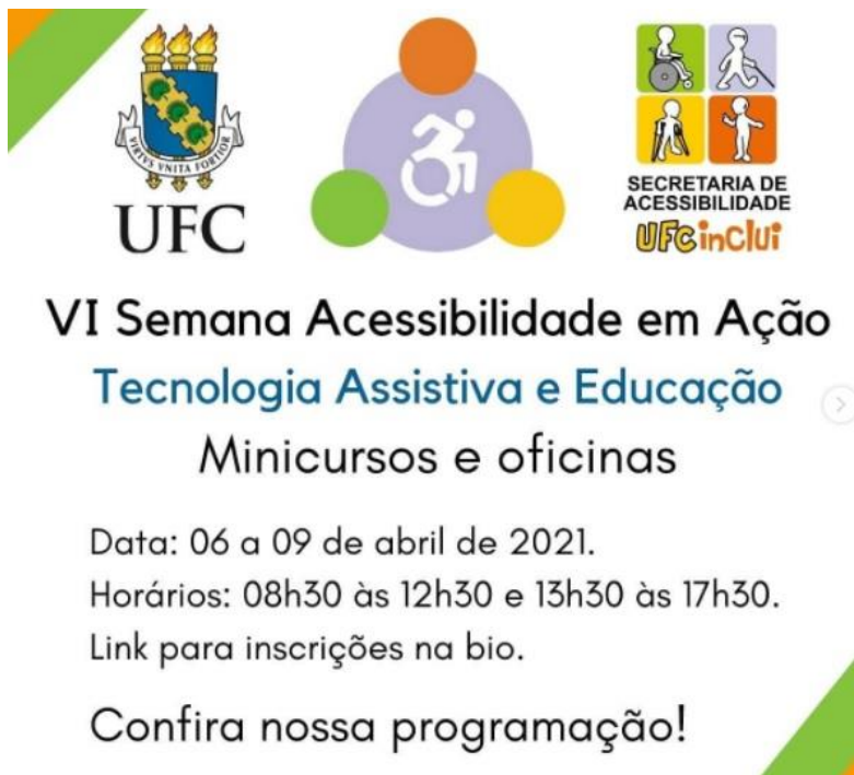
Figura: Divulgação VI Acessibilidade em Ação