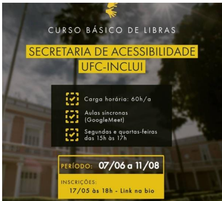
Figura: Divulgação Curso de Libras