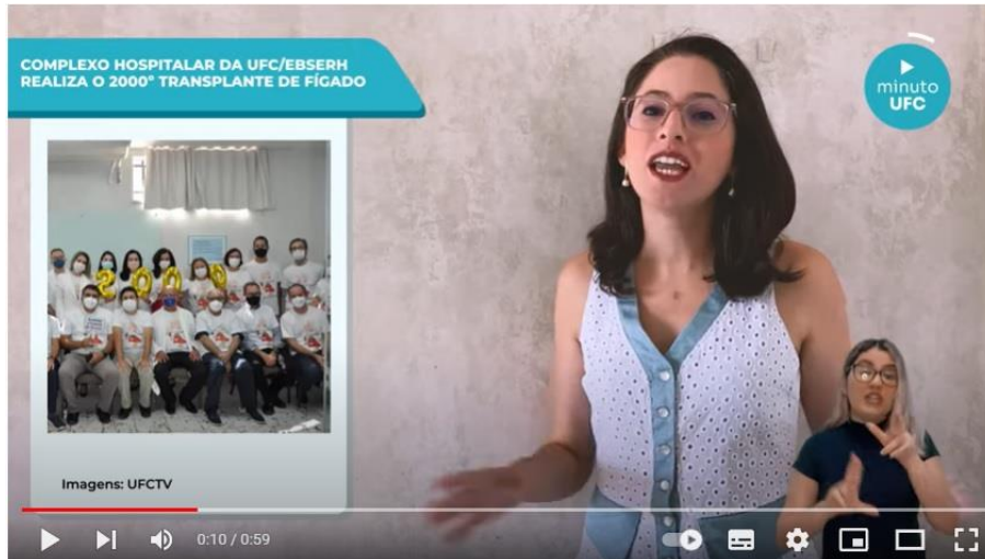
Figura: Programa Minuto UFC